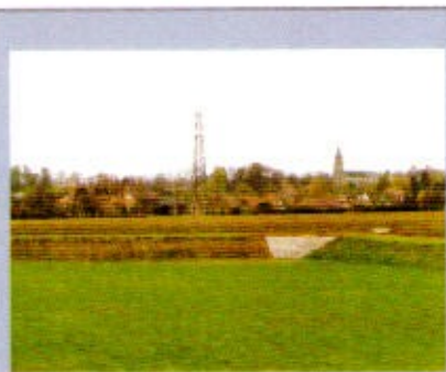
Engazonnement du bassin de rétention «Le Tournant»